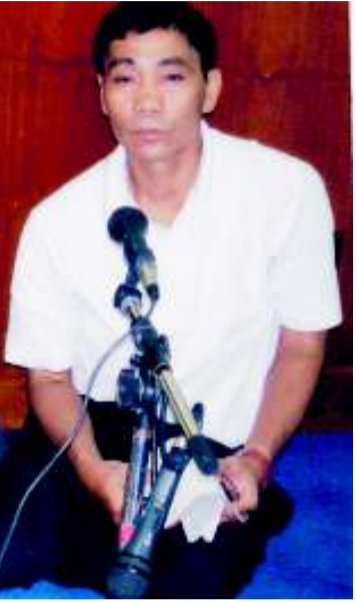
পী নিলকোমোল (ফর্ট ওলেম্পিয়ন)

রিও ওলেম্পিক ২০১৬ না লাকপদা রত্নেশ্বর গোস্বামী