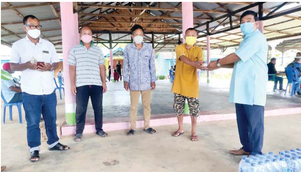
লমলাই এ সী কোভিড-১৯ এৱাৰ্ণেস এন ইন্ফোৰ্মেচন্স কন্সাল্টাংগী চেৱৰপাৰ্চন অমদি তেজ্জৌ চা শৈজাং জেদ পি মেম্বৰ এ জামিনি, কশিটি অসিগী মেম্বৰ অমদি তখেল সজ্জেনবম জি পিগী প্ৰধান এম নিংথেম অমদি কোভিড-১৯ সেক্ৰেড ৱেভ ফাইচি টাৰ্জ কোৰ্চ বি জে পি লমলাই মন্দলগী চেৱৰপাৰ্চন কে এচ ইংবামচাশী মীংয়েং মখাদা ব্ৰাসোন কোভিড-১৯ টাৰ্জ কোৰ্চ অমদি ৱাৰ্ড মেম্বৰনা শীন্দুনা ব্ৰাসোন কন্সাল্টাংগী হোলদা কোভিড ভেজ্জেনেসন পাঙথোকখিবা

গুৱাহাটী, জুলাই ২২ (এজেন্সী): লৈবাক অসিগী অৱাং নোংপোক খংবা স্টেটশিংদা ইন্দিয়াগী মৰু ওইবা মফমশিংদা মইহে তদ্বা নংগা থবক তৌদনা লৈরিবা মীওইশিংদা শক চু খেলবগী মিৎদা ওপী নৈবিবগী অমদি হুইশিংদা য়েংবগী য়ৌওং কয়া থোক্ৰি।