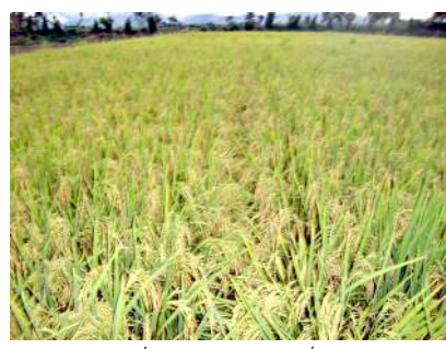
ফৌমাংনা থল্লবা লৌবুক

রোগিং করিনো : চাননবা থারিবা নংত্রগা ফৌদি পুথোক্কা থারিবা লৌফমদগী থারিবা ফৌদুগা মাদনবা অতোপ্লা ফৌ মখলশিং অমদি নাপি মরু পানবা নাপিশিংগা লোয়ননা লায়না তীলনা চেনবা পান্ধিবু খন্দেক্কা, লৌথোক্কা মাঙহনববু রোগিং হায়না খঙনৈ।