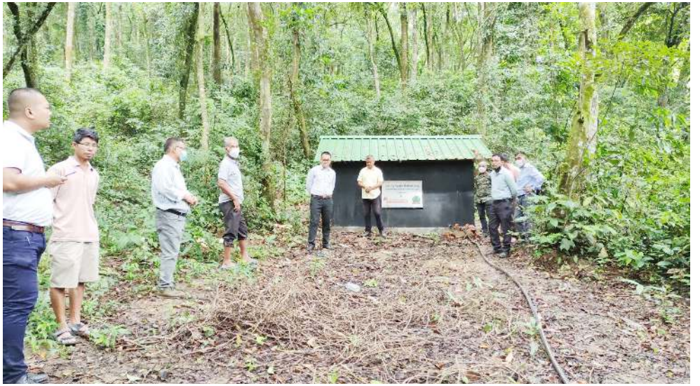
সেব্ৰেল ফোৱেট দিভিজন মন্ত্ৰিপ্তিৱা আই সী আই সী আই ফাউণ্ডেশ্যনগা খুংশমুদুনা ফোৱেট দিভিজন অসিগী মনুং চনবা মফম চ দা শাখিবা স্তিং ৰাট হাৰ্ডেণ্ডিং য়ুনিট

চাইনাগা অৰুনাচল প্ৰদেশকী দিষ্ট্ৰিক্ট অফ্ৰমা অৱানবা মওংদা চঙশিল্লক্ৰে হায়না অৰুনাচল প্ৰদেশকী বি জে পি এম পি তপির জাওনা পাৰ্লামেন্টত ফাওবা পুথোকপা লৈয়ে। অদুবু উসি ফাওবদা সেন্টৰগী মায়কৈদগী পাউখুম অমতা পীৱকপা লৈয়ে। মসি য়ালা লাইবক থিবা থৌওংনি। মহাক মশাগী মায়কৈদগীসু হিৰম অসিগী মতাংদা অফ্ৰমদগীসু ওইনা ৰাংহংহংবসু পাউখুমদি উসি ফাওবা ফংবা লৈতে হায়রি।