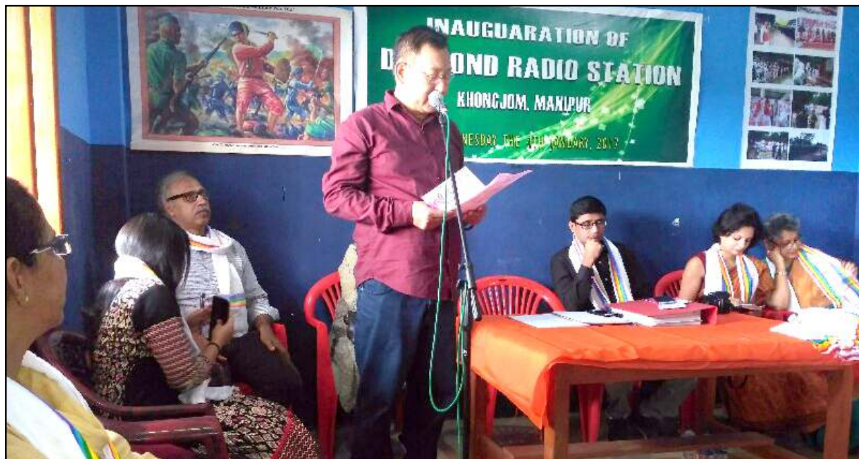
খোংজোম পুলিস ষ্টেশনদা হাংদেব্রি ডাইমন্ড রেডিও ষ্টেশনগা মৰী লৈনাদা অহানবা কমিউনিটি রেডিও এৱোৰনেন্সকী ৱাৰ্কসোপ পাউথোকপনী শত্ৰম

ট্ৰাণ্সমিছন/সৌজ নাহুবা, অমাঙবদা ঙৈ তৈৰকপা, ফনী শোনবা, খাঙ নাবা, শাগন নাম্মা হাইগৎপা ওমদবা, পুক নাবা, অমাংথোঙ ময়াদা মৱেং-মৱেং চৎপা, মসলশিং চিকপা-নাবা ফহনবগী ওজা জিয়া উল-হকপু থাগৎচরি