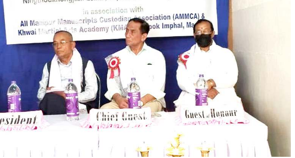
উরিপোক নিংখোংজম লৈকায়দা পাঙথোকখিবা নুমিং হমনি চখগদবা পুয়া এয়োরনেস কম এগজিবিবনদা দাইজ মেম্বর ওইবিবশিং