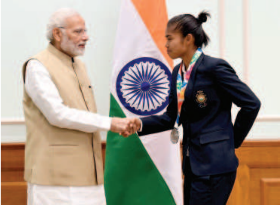
দ শান্নরায়শিং পুল এদা অর্জি। পুল এদা লৈখিবা টিমশিংদি অর্জেন্টিনা, ওষ্ট্রিয়া, সাউথ আফ্রিকা, উরুগুয়ে অমসুং ভেনেজুয়েলা।

প্লেয়র মাপনগী ওইবা যুথ ওলিম্পিক গেমস অদুনা শরুক যাজখিবা লৈবাকশিংদি অর্জেন্টিনা, ওষ্ট্রেলিয়া, ওষ্ট্রিয়া, চাইনা, ইন্দিয়া, মেক্সিকো, সাউথ আফ্রিকা, নামিবিয়া, উরুগুয়ে, পোলেণ্ড, ভেনেজুয়েলা, জিম্বাবুয়েনি। শুপ্রগী অনীন্দ খায়দরগা লীগ রাউন্ড