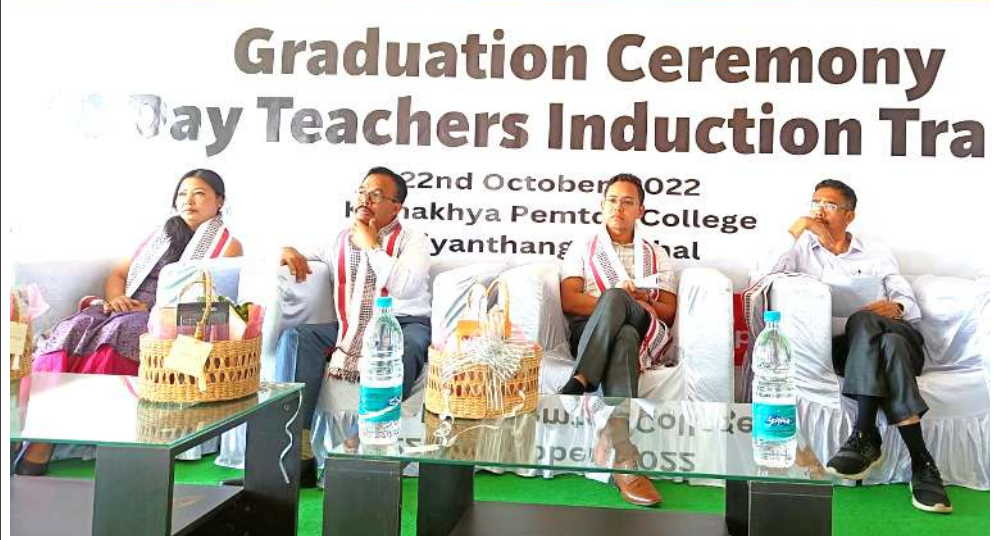
কমখা পেমতোন কোলেজ হিয়াংথাংদা নুমিং ১০ নি চখৰকখিবা ওজাশিংগী ইন্দ্রজ্ঞান ট্ৰেনিং প্রোগ্ৰাম লোয়শিনবগী থৌৱমদা দিগ্ৰিটৰি ওইখিবশিং

গুৱাং অমুক পুং ১০.৪৫ ৱোম তৱকপা মতমদা হেলিকপ্টৰ কায়বগী থৌদোক অদু থোকখিবা মতুং ৱেঙ্ক ৱাৰ্কৰশিং মফম অদুদা খুদুজা চঙশিমুদনা হেলিকপ্টৰ অদুদা তোংখিবা আৰ্মি পৰ্সনেলশিং থিবগী থবক চখাৰা হৌখিবনি। গুৱাং নুমিদাং অখংবা ফাওবদা হেলিকপ্টৰ অদুদা তোংখিবা মীওই ৫ গী মনুংদা মৰিগী হকচাংশিং ফংবা গুমখি। মদুগী মতুং ওসি অমুক ৱেঙ্ক ৱাৰ্কৰশিং মঙাশুবা হকচাংশিং অদু হেলিকপ্টৰ কায়ফম মনাজুগী ফংবা গুমখিবনি হায়রি।