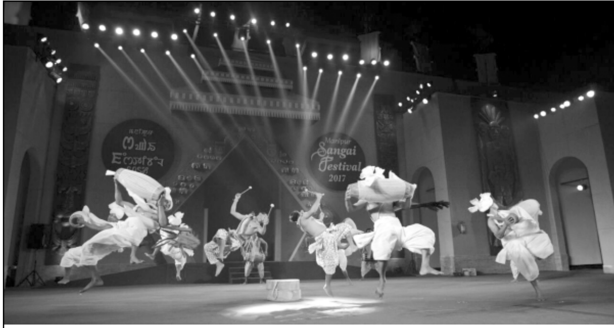
তাগাচন্দ্র ওপন এয়র থিএটরদা পাঙথোকপা মণিপুর সঙাই ফেষ্টিবেলগী নীনি চনবা নুমিত্তা উৎসব পুং চোলোমগী নিংথিগা শজ্জা