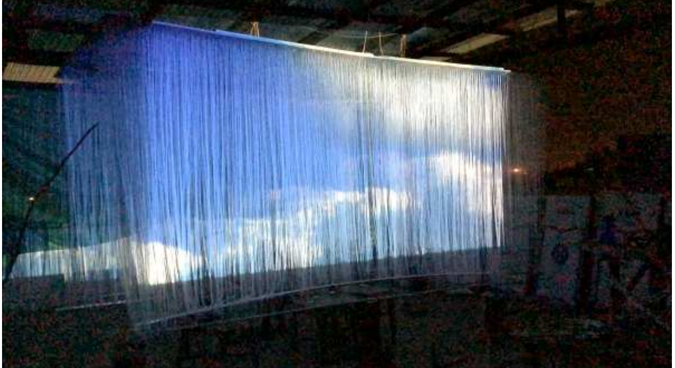
এসেস ওফ রিএলিটি (আৰ্ট ইন্সটলেশন ২০১৮)

পাউচে অসিদা ফোঙজরিবা বারেশিং অসিগী রাখল, মীংয়েং অইবা মশা মশাগীনি। পাউচে অসিগী রাখলোন অমসুং মীংয়েংগা থোইদোক্কা মরী লেনদে।