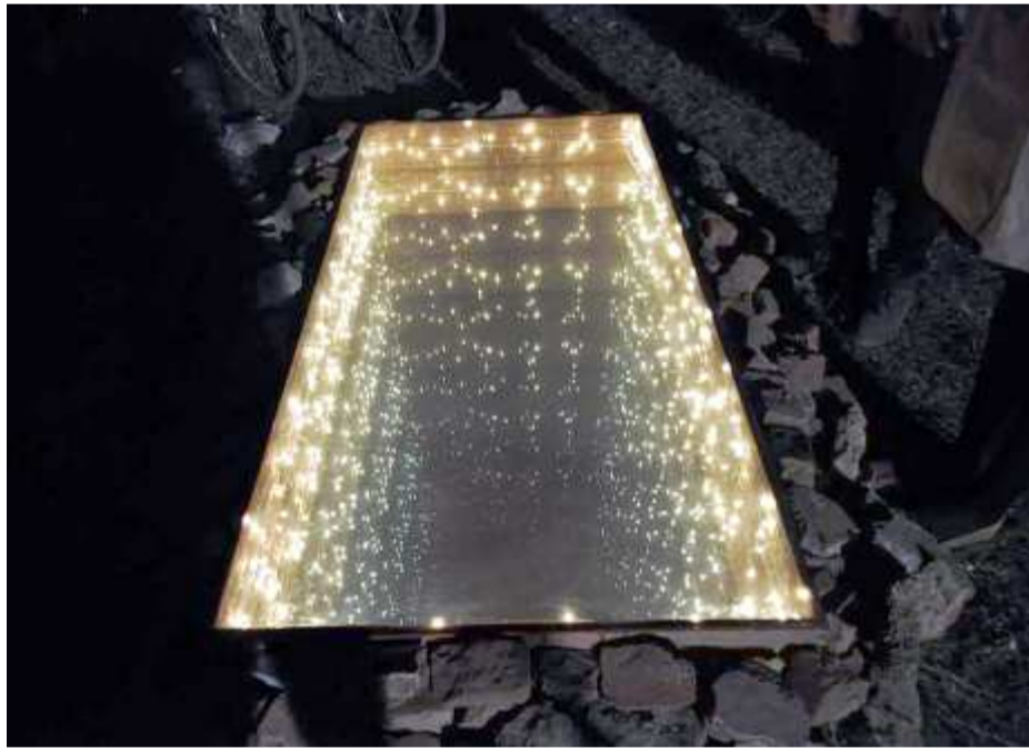
ইনটু দি অদর দাইমেন্সন (আৰ্ট ইন্সটলেশন ২০১৪)