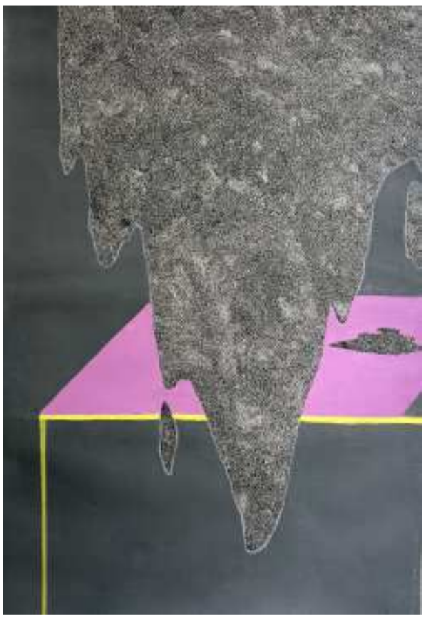
মেমরি ওফ এ স্পেস ২.১ (সেরিজ ২০১৮)