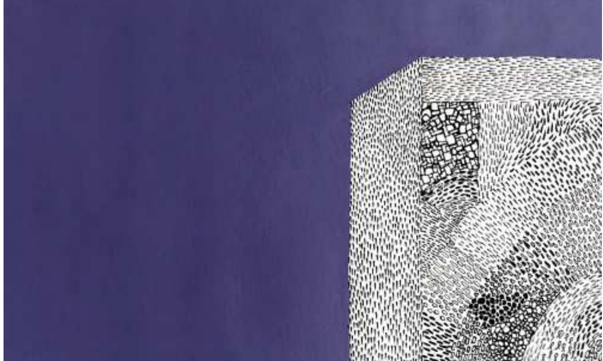
মেমরি ওফ এ স্পেস ১ (সেরিজ ২০১৮)