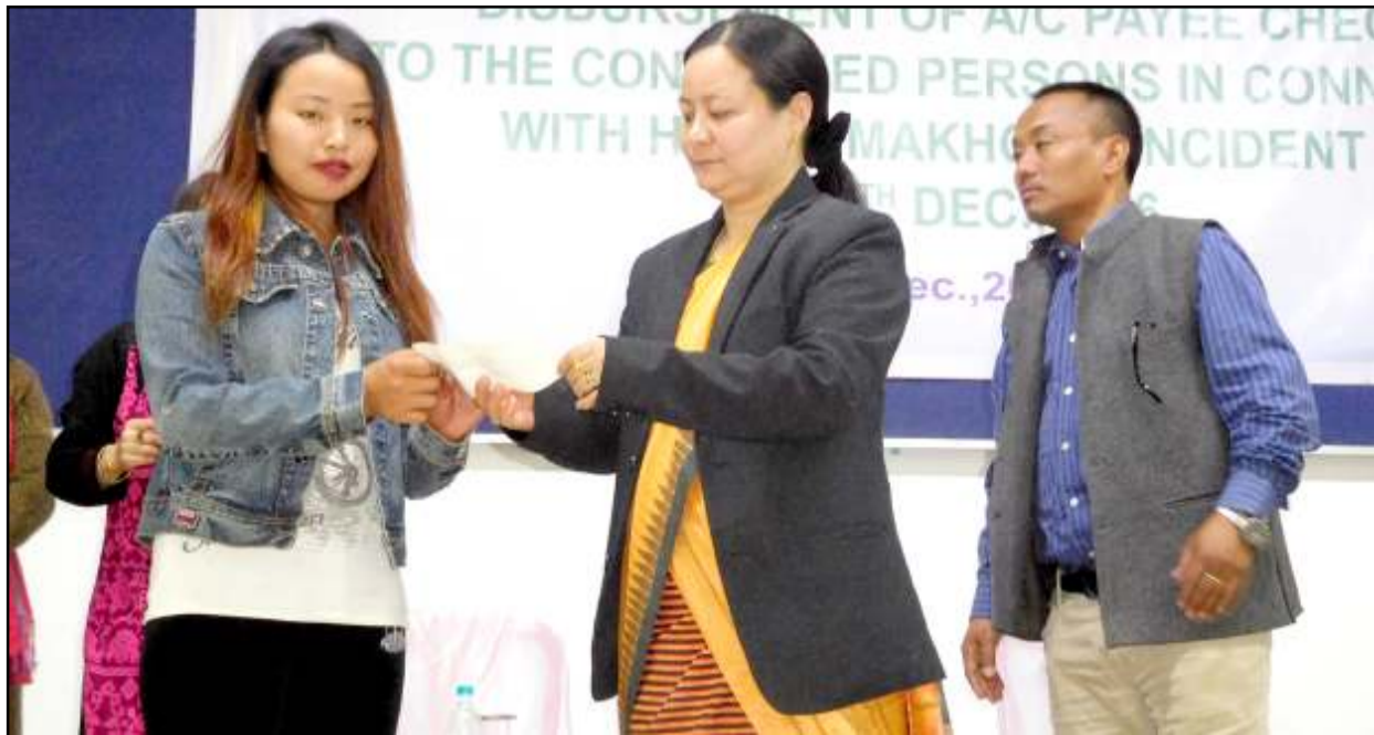
মীয়ামগী মোবনা খুইই হৈফ্রুমাখোঙা গাভী মে থাখিবা অমসুং মইহৈরোয়শিংগী মগোং-মটৈ মাঙ-তাকহনখিবাশিংগী কম্পেন্সেসন ইফ্রাল ইষ্টকী ডি সীনা য়েহোকপা