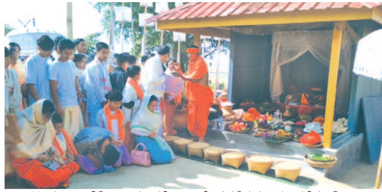
মৈতৈ লাইকোল থল্লো সিপী লোক শেল্লোই লংমাইচিংদা পাঙ্খেবাকখিবা ফৌওইবী ফৌকৌ লোল ইরাৎ থৌনি থৌরমগী শক্তম

ট্রাল্ডস্মের্ণ/খোঙ হাম্বদা অমাঙ্তথোং ময়াদগী সিরিঞ্জনা কাপ্লকপগুমা ঈ কাপথোরকপা, খোঙ তোয়না হাম্বা, অমুক্তদা শেংনা হাম্বা য়াদবা, মচিৎ মচিৎ হাস্তা, খোঙ হাস্তা মতমদা অমাঙ্থোং মনুংদগী খুৎবীমুক চাওবা অমা ইন্থরকপা ফহনবগী ওজা জিয়া উল হগপু থাগৎচরি