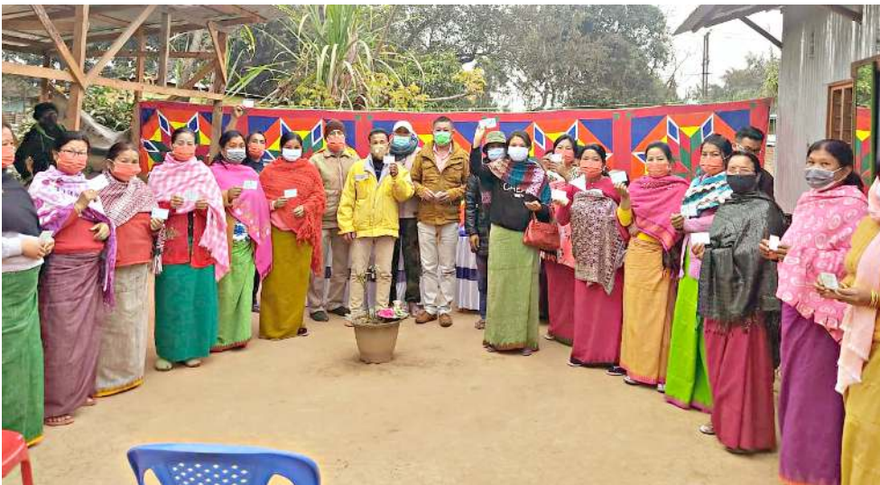
যাইৱিপোক সিফই লৈকয়দা লৈবা সোসল ৰাৰ্কৰ টি এচ সঞ্জয়গী য়ুন্দা যাইৱিপোক মুনিসিপাল কাউন্সিল ৰাৰ্দ নম্বৰ ১গী বেনিফিসিৱ ১০৮দা ই শৰ্ম কাৰ্শিং য়েংলোকখিৰা

অমৰোমাদা, উলফা - আইগা মে ১৫, ২০২১দগী থম্মৱকখিৰা সিং ফায়ৱগী য়ানবা অদু তাক্ক নাইনা শাংলোকহল্লত্ৰনা হৌজিক ফাওৰা লৈৱকখিবনি। উলফা-আইগী মায়কৈদগী লৌৱকখিৰা থিৰেপ অসি য়েংলদনা লৈবাক অসিগী ওথাৱিটিংগী মায়কৈদগীসু লালহৌলুপ অসিগী মখত্ৰা চখৰা ওপৱেসনগী থবকখিং হুন্দাভুনা লাকখিবনি।