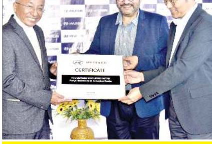
সাউথ কোরিয়ায় গী মন্ডা... সোউথ কোরিয়ায় গী মন্ডা...

যু আর সীগী মখাদা লৈবা... লামায় ২... লামায় ৩... লামায় ৪... লামায় ৬