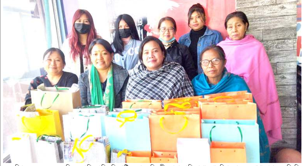
ওল মণিপুৰ ৰেপ্ল মেকৰ এসোসিয়েশননা শিন্দুনা ৰিপ্ৰেচিং প্লাষ্টিক বেগ অমদি চেণী বেগ হায়বা থিমদা পাণ্ডথোকখিবা এৱাৰনেস প্ৰোগ্ৰামদা শৰুক য়াখিবাশিং

তোকখিবা। হৌখিবা কুমজা ২০০৮ তা সালেং ইহান হায়া কোংগ্ৰেচকী টিকেটতা মায় পাল্লকখিবা। মদুগী মতুং হৌখিবা কুমজা ২০১৩ দা পাণ্ডথোকখিবা মীখলদা কোংগ্ৰেচনা টিকেট পীৰজবদগী ইন্ডিপেন্দেন্ট মীৰেপ ওইনা মীখল লম্বা তৌনখি অমদি মায় পাকপা গুমাখিবা হায়রি। অ মৰোমদা সালেং এন সী পিদগী তোকখিবা মতুং কোংগ্ৰেচ মীৰেপ ওইনা মথং থাদা পাণ্ডথোকদৌরিবা মীখল অসিদা লম্বা তৌনগনি। মহাক্সা লম্বা তৌনগদৌরিবা মীৰেপনা এন পি পিগী কেদ্দিদেট ৰেকেস এ সংমাগনি। পনবা যাবদি সীট ৬০ লৈবা মেঘালয়া লেজিসলেটিব এসেমব্লিগী মীখল অসি মথং থাগী ২৭ তা পাণ্ডথোক্ৰবা ইলেক্সন কমিশননা লাউথোকখিবা।