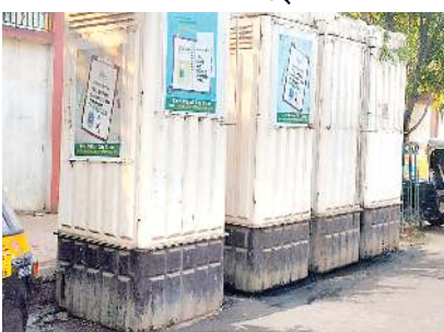
ডা. খাইদেম অখৌবা ইফাল, ফেব্ৰুৱাৰী ২৩ (ঐচএনএস): ইফালগী শকয়েন মিংশেল

স্কুল মাংগী ফুট পাঠকী মতাইদা থমজিল্লিবা মোবাইল টোইলেটকী চেহুৱকপা ফত্ৰবা মনম নমখিবা পোংকশিংনা অচং-অওকশিংদা চাওনা খুদোংচাদবা কয়া মায়েক্ৰে।