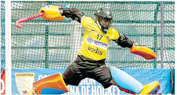
শাৱনায়শিংনা মহাকপু মামাৰা নংত্ৰগামনা ওনুপী অমগুয়ায়াল্লা লুনা তৌখি হায়ৰি।

নুদেী, ফেব্রুৱাৰী ২৩ (এংকলী): ইন্দিয়ান সুপাৰ লীগ জুনিয়ৰ হোকী টিমকী কেপ্টেনসু ওইৰিবি গোলকিপৰ খাৰিবম বিচুনা ফোঙদোকখিবা, মহাকী মশান্দা চাওনা মতেং পাংখি হায়না ফোঙদোকখে। কু মজা ২০১৮গী যুঠ ওলিম্পিকত ইন্দিয়ান সুপাৰ লীগ জুনিয়ৰ হোকী টিমনা পুৰাৱীদা অহনবা ওইনা সিলভৰ মেডেল ফংদনা ফজবা ওমখি। হায়ৰিবা যুঠ ওলিম্পিকত অদুনা খাৰিবম বিচুগী মায়খি হায়না ফজবা মশানা উৎপা ওমখি।