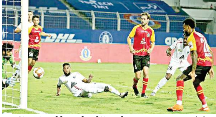
নোর্থ ইষ্ট যুনাইটেদ এফ সীনা এস সী ইষ্ট বেঙ্গলকী গোল তপ্পা পাঞ্জল চননবা বোল কাওশিনখিবা

ফটো, ফেব্রুৱাৰী ২৩ (এংকলী): ইন্দিয়ান সুপাৰ লীগ ফুটবোল টুৰ্নামেণ্টকী ১০৪শুবা মেটচত নোর্থ ইষ্ট যুনাইটেদ এফ সীনা এস সী ইষ্ট বেঙ্গলৰ পাঞ্জল ২-১ দা থোইদুনা টুৰ্নামেণ্ট অসিগী প্লে ওফকী খুদোংচাবা লৈহনখে।