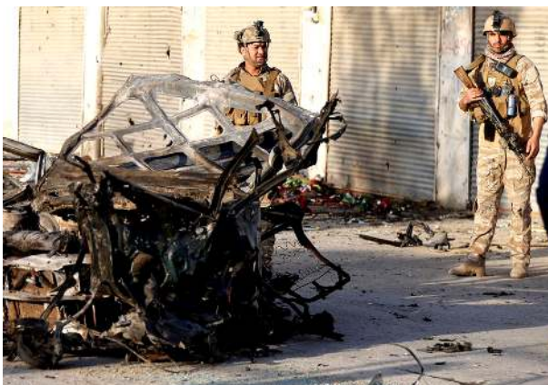
ওথৰশিংনা মীচমশিং শিবা শোকপগী চাং পিছ টোক হৌখিবা কুমজা ২০২০ গী অৱেয়বা থা অহমগী মনুংদা খঙৰাং ৰাংখংলক্খি।

কবুল, ফেব্রুৱাৰী ২৩ (এজেন্সী) : অফঘানিষ্টানদা মৰা তপ্পা ফীভম লাকহম্বা হৌখিবা চহীদা ৱাৰী শানবা হৌখিবদগী লৈবাক অসিদা মীচমশিংদা টাৰ্গেট তৌদনা হাংপা-তপ্পা খঙহেন হেনগৎলক্লে হায়না যুনাইটেড নেসন্সনা লৈবাকপোকপা নুমিত্তা ৱিপোর্ট অমদা ফোণ্ডদোক্লে।