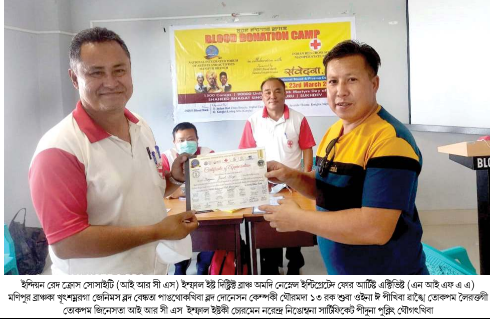
ইন্দিয়ান ৱেদ ফ্ৰেস সোসাইটি (আই আৰ সী এস) ইফাল ইষ্ট দিল্লিক্ৰাফ অমদি নেমেল ইন্টিগ্ৰেটেড ফেৰ আষ্টি এষ্টিভিট (এন আই এফ এ এ) মণিপুৰ ব্ৰাঞ্চকা খুংশম্ভৰগা জেনিমেস ৱদ বেহুতা পাঙথোকখিবা ৱদ য়োনেসন কেণ্ডেইন য়ৌৱমদা ১৩ ৱক শুবা ওইনা ষ্ট পীখিবা ৱাষ্ট্ৰে তোকপম লৈৱত্ৰী তোকপম জিনেসতা আই আৰ সী এস ইফাল ইষ্টকী চেৱৰমেন নৱেৰন নিঙেহুনা সাৰ্টিফিকেট পীদুনা পুৰিঙ য়ৌগখিবা

বি জে পি ৱাৰ্কৰশিংগী এটেজা কোংগ্ৰেস লুচিংবা ১ শাখিনা শোৱ্কে গুৱাহাটী, মাৰ্চ ২৩ (এজেন্সী): অসাম মাদা পাণ্ডাৰোৱাৰিবা ষ্টেট এসেমব্লী ইলেঞ্চন ২০২১ গী মাঙওইননা কোংগ্ৰেস কেণ্ডিডেটশিং অমদি লুচিংবাশিংগী বি জে পি ৱাৰ্কৰশিংগী ওইননা য়াই চিনবশিংগী য়ায়া তেয়না এটেক চখৰি। উসিস্ গোলাগাট দিল্লিকী মনুং চনবা খুমটাইদা বি জে পি ৱাৰ্কৰশিংগী কোংগ্ৰেস লুচিংবা অমা ফুৰহুদগী শাখিনা শোৱ্কে হায়রি। খুমটাই লেজিসলেটিভ এসেমব্লী কলট্ৰিয়েন্টিগী মন্দল প্ৰসিডেট ৱহুদ দক্তা বি জে পি ৱাৰ্কৰ ১৫/১৬ ৱোলা খঙহৌদনা এটেক চখৰকিবিবনি। খুমটাই এসেমব্লী কোংগ্ৰেস মীৰেপ ওইনা খোৱিক্ৰিা বিসমিটা গোগোইগী ইলেঞ্চন কেণ্ডেইন য়াওৱৰগা ময়ুদা হুৱকপগী লগীদা এটেক অদ্ চখৰকিবিবনি। বি জে পিগী ৱাৰ্কৰশিংগী অদুনা দক্ত