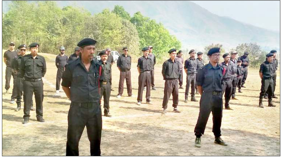
য়নিভার্সেল ফ্রেন্ডশিপ ওর্গানাইজেশননা শীপুনা চিংনুংখোক হেডকোয়ার্টা পাঙথোকখিবা ২৯শুবা মার্চ কম্প লোইশিনবগী থৌরমদা শরুক য়াখিবা কম্পারিশিং

লাউথোকগনি হায়খি। অমরোমদা, মিজোরামগী নোংপোক থংবদা লৈরিবা চম্ফাই টাউনদা হন্দজা ওকশিং শিখিবা অদু অফ্রিকান স্বাইন ফিভর হায়বা খঙলে হায়না ওফিসল ষ্টেটমেন্ট অমনা ফোঙদোকপে। চম্ফাইগী ইলেক্ট্রিক ডেঙকী অকোয়বদা ওক শিবগী রিপোর্ট লাকখিবা মফমশিং অদু অনৌবা ওর্দর অমা থোক্তিবা ফাওবা থা অসিগী ২১দগী কন্টেনমেন্ট এরিয়া লাউথোকপে হায়না চেচোল অদুনা মফা তারি। মিজোরাম অমদি মণিপুর অনিগী লোমবা সকাওদাই ভিলেজদসু ওক শিবগী রিপোর্ট লাকখি অমদি শবে দারক্সিবা লায়না অসিবু ঙাকথোক বা ওক ১০,৯১০ হাংগে হায়না মিনিষ্টরনা মফা তারি।