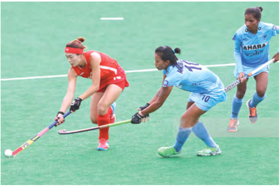
থেশ্যায় শোকখি... কুমজা ২০১৬গী রিও ওলিম্পিক গেমসকী ওলিম্পিয়োগা শারাবদা এনা গোল অমা চনবা ওমখিবদগী বারী অমসু লৈ।

কুমজা ২০১৬গী রিও ওলিম্পিক গেমসকী ওলিম্পিয়োগা শারাবদা এনা গোল অমা চনবা ওমখিবদগী বারী অমসু লৈ। মদু তশেননকীদি অমত তানবদগী চনবা ওমখিবনি খল্লি। ঐথোয়না শারাব হোইড্ৰিঙে নোংমা নীনিগী মমাওদা নেসনল পেপার অমগী মিদিয়া পার্সনি হায়বা মীওই অমদগী ফোন মথং মথং তৌরুক্কা ঐথোয় খরাতৈরিত্তি তৌখি। মহাক্কী মিমিংদুদি কাউরে। মহাক্কী ইন্টাৰ্ভিউ তৌরকপসিদা অহানবা রাহংসি অসম্মা হংলকখি। ফোরদ শারাবয়ে অম ওইনা নঙগী মক্ ওইবা এমসি করিনো? ফষ্ট প্লে ওইগদৌরিবা জ পানগা শারাবদা নঙগী টাগেটসি করমহায়না থল্লি হায়রকখি। মদুদা এনা ঐহাক্কী ওইনা ফষ্ট মেচসিদা গোল অমা চনগে খল্লি। চনবসু ওমগনি হায়না খল্লি অসম্মা খুমখি। ফষ্ট শারাবদা ইন্দিয়া টিমগী অহানবা গোল চনখিবা ঐহাক্ ওইজনিংই হায়নসু ফোঙদোকখি। অদুৰ্ ঐহাক্ জপানগা শারাবদি মেচতুপা গোল চনবা ওমকখিগে। মদুদা মহাক্কী মেসেজ অমা থারকখি, নঙনা গোল অমা চনবা ওমগনি হায়না মিদিয়াদা ফোঙদোকখি চনবা ওমকখিগে করিনিগী? প্লেয়ৰ অমা ওইনা নাহক হায়দোকখিবা রাডি ওচ্ৰা চপা ফে হায়না থারকখি। প্ৰেসমেন্দুগী মেসেজ দু পাজৰবদগী ঐহাক্