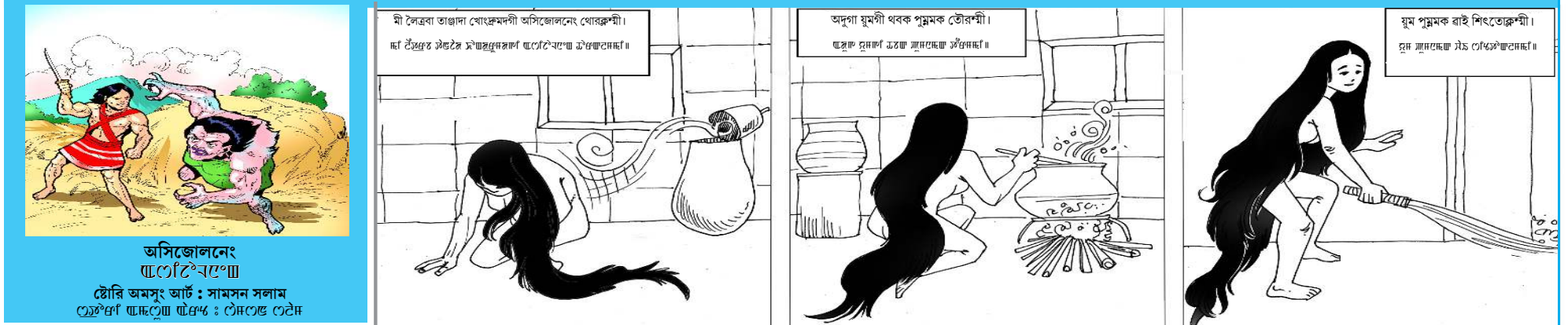
অসিজোলনেং হোম্পিটাল... ষ্টেট অসিদা... সানসন সলাম... ষ্টেট অসিদা... ষ্টেট অসিদা...

ইফাল, মে ২৩ (এচ এন এস): প্ৰাইভেট স্কুলশিংগী ট্ৰান্সন ফি অমদি মইৱেয় থিদোক-খিঞ্জি তৌৱিবা ভেন সৰ্ভিসকী শেল তংখায় লৌবীযু হায়না ওল মণিগুৰ নুপী মৰূপকী সেক্ৰেটাৰি সুমতিবালানা প্ৰেসতা থাদাৱকপা চেৱোল অমা হায়ৱি। চেৱোল অদুনা হায়, কোভিড-১৯ লাকশিৰবা লৈওক্তৰ মই লায়লশিং মতম কৰ্ত্তনা থিৱে।