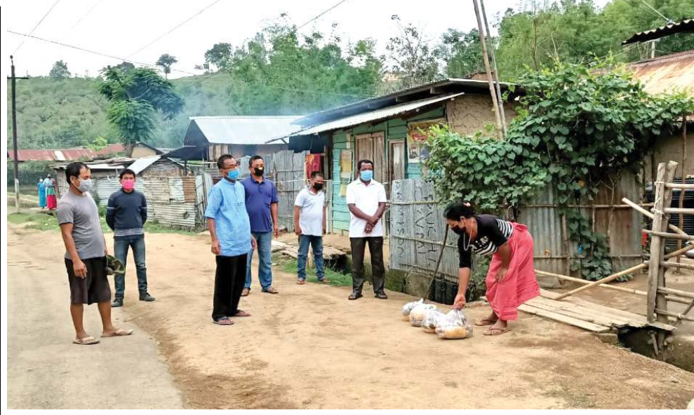
মণিপুর প্রদেশ কোংগ্রেস কমিটিগী কো-ওপটেদ মেম্বর অচেইম দেবেননা লমলাই এ সীগী মনুংদা লৈবা তোঙন তোঙনবা কমিটিশিংগা খুংশম্বরগা এ সী অসিগী কন্টেনমেন জোন লাউথোকপদা মফমশিংগা চানা থক্কা পোংলমশিং তেংবাং নীখিবা

অগরটলা, মে ২৩ (এজেন্সী): ত্রিপুরা পুথোকশিং বেম্বু লিফ টিগী পুথোকশিং অসি অতোপ্লা ষ্টেটশিংনা য়ায়া পাম্বা শীজিমবগা লোয়ননা দিমান্দ তৌবগী চাং হেনগৎলকখিবগা প্রদক অসিবু পুথোকপদা অতোবা খোদাং লৌরিবা সমির জামাতিয়ানা ফোঙদোরক্লি।