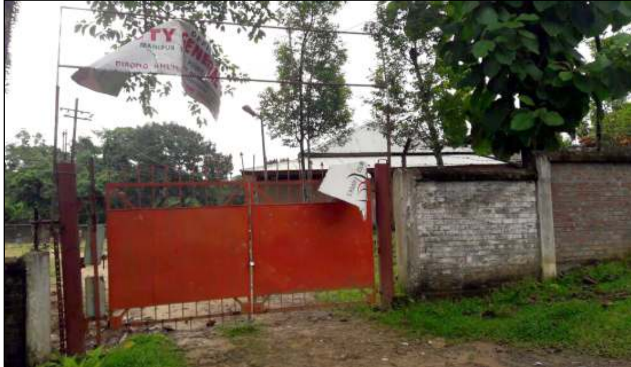
ডিবেং খুইনৌদগী কাইমাই ফিদরদা মৈ চাং নাইনা থাদে হায়বা রাইহৌদী ককুমুরশিংনা নুংনা থাবদগী অমাঙ-অতা খেল্লবা এম এস পি ডি সী এল জিবি ব্রাঞ্চকী ওফিস