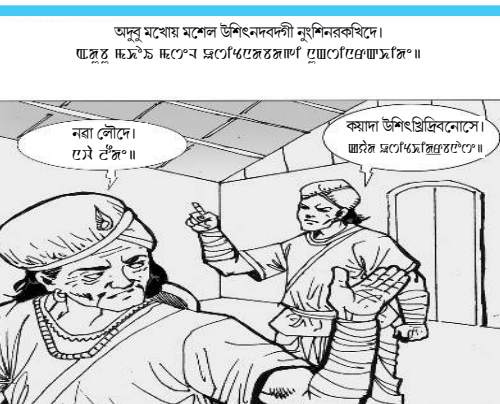
কাদা উশিং ভিৰিৰিনোসে জুৱৈ মসৌমসিহুৱাংগে