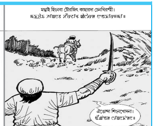
মজুই হিৎবা চেইজিৎ কাছাৱদা চেমিৰনী।