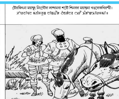
টৌজিঙনা ময়াজু নিংখৌদা লাখনবা শৰৌ শিনবদা ময়াজুনা খঙদোকথিবনী।