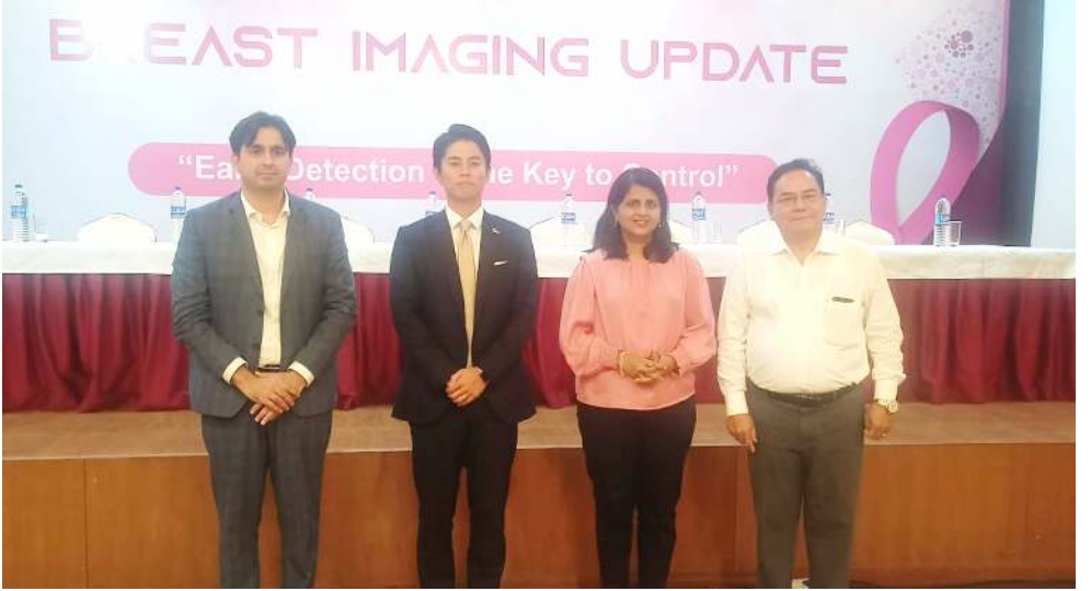
ফুজিফিল্ম ইন্দিয়ানা শিল্পনা হোটেল ক্লাসিক গ্রান্দেদা ব্রেস্ট কেন্দ্রগী মতাংদা পাঙথোকখিবা এরেনেস প্রোগ্রামদা রাঙাঙলোই ওইখিবশিং

পার্ক ওফিসল অসিনা ফোঙদোরকখিবগী মতুংইয়া, রোদরগী ফিভম কা হেন্না ফভবনা মরম ওইরগা পার্ক অসি হাংদোকখিবগী চপ চাবা মতম অমা মরী লেনবশিংনা লেগ্না ওমদনা লাকখিবনি। অদুদা মখং থাগী ১৫ দা পার্ক অসি অমুক হয়া হাংদোকখি। লেপুখিবনি। পার্ক অসি হাংদোকখি। লেপুখিবসু রোদরগী ফিভম ফংব্রাবদি খুদক্সা থিংজিনবা যাবগী ওইখোকপসু লৈরি। অমরোমদা পার্ক অসিদা অনৌবা শক্তম খবসু শেম শাবগী থবক লৌশিল্লক্সে হায়না মখা তানা ফোঙদোরকি।