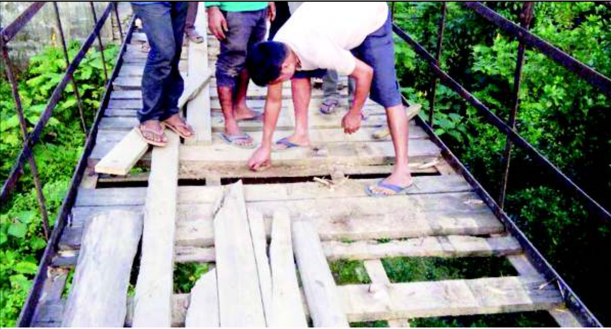
গোৰ্খালৈদ তুৱেলগী মখতা শাবা থোং চংপা য়াৱজবদগী বৱাক ব্ৰদৱস য়ুনিনয় (বি বি য়ু) জক্ৰাথোৱ জিৱিবামনা মীয়ামগা লোয়ননা শেমজিনবা

টোম্বাৰ্গ/শৌজ নাহুৱগা মৈনা পোকপগুমা লোক লোক লাউৱগা মচুম তাবা, খোঙ হান্দ্দা অমুজা শেংনা হামদোকপা যাদবা, অমাঙথোং ময়াদা পোন্নাগা নাই চাৱকপা, খোঙ হান্দ্দা খুদিং ঈ দ্ৰোপ-দ্ৰোপ তাৱকপা, ফক্কা ৰাংপা, খুকউ চিকপা ফহনবগী ওজা Zia-UI-Haque পু থাগৎচৰি