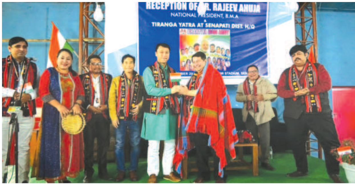
তিরঙ্গা যাত্রা শরুক যাত্রীভা ভারতীয় মোদি আর্মিগী নেসনল প্রসিডেন্ট ডা. রজিব অছজাবু সেনাপতি মিনি ইন্দোর ষ্টেডিয়ামদা ওকপগী খৌরম

ট্রাফিক/অমাংখোং তংলগা য়ায়া চিকপা নাবা, অমাঙথোং মনুংদগী ইছরকগা চাউনা পোমখোংলগা লৈবা, খোঙ হায়া য়াদবা, পুজা গেষ্টিক কাবা, চাবা তুমদবা, চাবা তুমদবনা মরম ওইদুনা খরা হেঞ্জিমা চাগদবা কিবা, শা-ঙা, থাউ, মোরোক চাবা য়াদবা ফহনবগী ওজা জিয়া উল হগপু থাগচরি