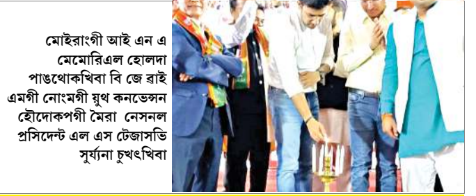
মোইরাংগী আই এন এ মেমোরিএল হোলদা পাঙথোকখিবা বি জে রাই এমগী নোংমগী যুথ কনভেনশন হৌদোকপগী মৌরা নেসনল প্রসিডেন্ট এল এস টেজাসভি সূর্যনা চুখংখিবা

CALL 1950 TO CHECK NAME IN ELECTORAL ROLL