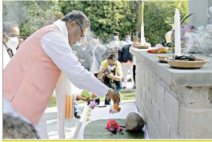
এগুলো মণিপুর বার, ১৮৯১ মায়থীরবা মতুন্দা বৃষ্টিনা অন্দমান নিকোবরদা লোই থাখিবা নিংখৌ কুল্লাচন্দ্র যাওনা নীতে অখৌবা ২৩না মফম অদুনা থুংখিবা নুমিং, নবেম্বর ২৩ নীংশিংদুনা হৈক্ব লৈক্ব অখিবা

এয়র পোল্লাসননা হকচাংগী তোঙান তোঙানবা কয়াংশিংবু করুনা শোকহনবগে?