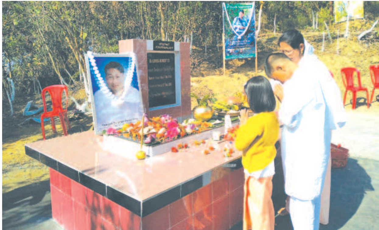
লেখিচব্বা পাউমী বীজমনিগী ও লক শুবা নীংশিং কুমওনদ পাউমীশিং অমসুং মীয়ালা চৈরাওচাঁদা লৈবা খুতমদ লৈ-শু কতুনা ইকাই খুম্বা