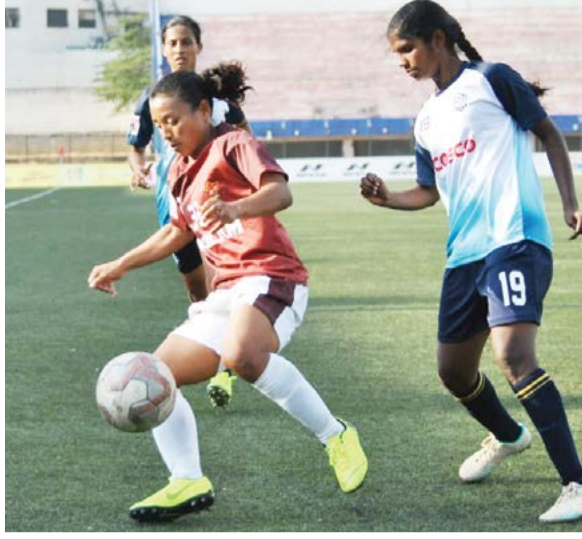
উখোক্কাবগী মতম অমা লাকপসিদা এখোনসু কুপা শেমদুনা ইশা-ইশাগী খোঙফম খরদি শেমহৌবা চুমগনি। মতম চানা হোংনহৌবা হায়বসিনা ঋইদগী অফবসু ওইগদৌবরিনি। মতাং মতম চানা শিবীরকপা প্রোগ্রাম হায়বসিদি লৌনমকসু অফবা হেজা ওইগল্লি। পুঞ্জিহা অহানবা ওইনা ফুটবোলদা খোঙদাজরকপা মতম কুম্জা ২০০১-০২ অসিদা ওল মণিপুর ফুটবোল এসোসিয়েশন পায়খংপা ফুটবোল ডিভলপমেন্ট প্রোগ্রামগী শরুক অমা ওইনা খোঙজোমগী তেচকমদা পাণ্ডথোকখিবা অসিদসু

কাঙবুনসু এখোয়বু ইকায়খুম্বা উৎপীদুনা ফেব্রুৱারী ২৯দা ওকপগী যৌরম অমা পাণ্ডথোক্কাদৌরি। মদুগী চংখোক-চংখিনগী টিকেটমচিংবসু হামনা থারকপ্তে। এগীদি মেচ মরিদুগী লুপা লিশীং হুশুফতরা ফংগনি। অমরোমদা, ফুটবোল্লর অমা ওইজরকপগী নুংইহা খরা মতমগী মতুংইয়া লাকপসিসু তশেংনা হায়রগদি পুঞ্জিহা অপেনবা পোকই। মসিগুয়া খুদোংচাবা খরা অসি পুঞ্জিহা ফংগনি থাজরকদা ওইজনি। ওল ইন্দিয়া ফুটবোল ফেদরেশন হৌখিবা চহী খরগী মমাঙ হায়বদি কুম্জা ২০১৬/১৭তগী আই দলীয় লীগকা শিবীরকুনা নুপী ফুটবোল্লরদমক করিগুয়া খরা তৌবীরকপসিমদি মণিপুরগী ওইনা