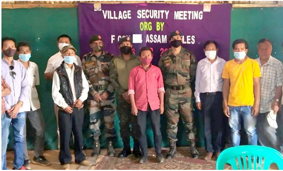
সংস্কৰ বাটালিয়নগী অসাম ৰাইফলসনা শীন্দুনা কাসোংদা পাঙথোকখিবা ভিলেজ সেকুৱিটি মিটকী যৌৱনমা শৰুক য়াখিবাখিং

অগৰটোলা, মাৰ্চ ২৪ (এজেন্সী): ত্ৰিপুৱা পুলিসনা ধৰমনগৰ প্ৰাগাটি ৰোদত গুৰি চাৰুখিবা থি হুহুগী যৌৱন অমদা হেৰোইন গ্ৰাম ৪০ গা লোয়ননা হেৰোইন অদুৰ পুদুনা চল্লগা মীওই অমা ফাৰে হায়ৰি।