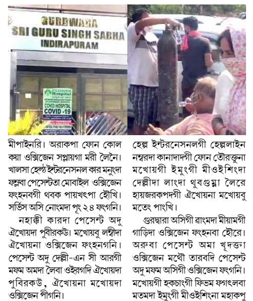
মীপাইনবি। অবাৰুপা ফোন কোল কৰা ওক্সিজেন সপ্লায়গা মৰী লৈনে।

ঘাজিয়াবাদ, এপ্রিল ২৪ (এজেন্সী): লৈবাক অসিনা কোৰোনাভাইরাস কেস লেগুনা হেনগলকপগা লোয়ননা হেল্পে সৰ্ভিসশিং প্ৰেসর চাওনা লৈরি। হোম্পিটালশিংদা অনৌবা পেসেন্টশিংদা হেদ লৈরকগা লোয়ননা ওক্সিজেন রাংপগী অটোবা প্ৰোগ্ৰেম অমা থোরিক্ৰিবিং ইয়ংদুনা ওক্সিজেন মথৌ তাবা পেসেন্টশিংদা অটোবা কোক্ৰহাৰগীদমত্ৰা নেসনল কেপিটেল রিজন (এন সী আর) দা লৈবা ওক্সিজেন অমনা ওক্সিজেন লেঙ্গাৰ' সৰ্ভিস অমা হৌদোক্সে।