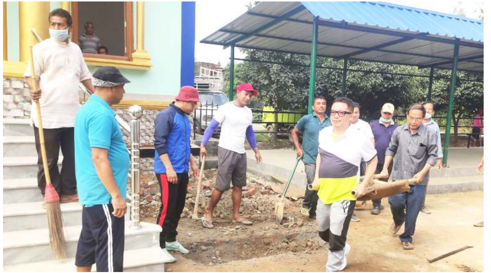
ককচিং এ সীগী এম এল এ মশা য়াওনা ককচিং ৱাইৱী ইবুথৌ খল্লংবগী নৌনা শাবা সনা শঙলেন শঙ্গানবগীদমক লম-তু শিং শেংবা

অদুৱ মহাক্ৰা মতোমতা শিজৱল্লো অদুগা মরী লৈননা সুসাইদ নেট অমতা ইৱন্থি থেংনখিদি। মদুনা মৱম ওইৱগা মহাক কৱি মৱমগীদমক মশা মতোমতা শিজবা তমখিৱা ফিৱেপ অসি লৌৱমখিবনা হায়বা খঙবা ওমদি। পুলিসনা থৌকো অসিগী মতাংদা কেস অমা লৌখল্লো থিজনবগী থবক চখাৱা হৌৱে। মহাক মশা মতোমতা শিজখিত্ৰা নংৱগা অতোৱগী খুজিল থোৱাং য়াওৱা হায়বদু খঙদাক্লবগীদমক মহাক্ৰা হাৱা নক্লৱা অমদি কোলেজগী মরী লৈনবশিংদু ৱাহং পাউহং চখাৱা হৌৱগনি হায়খি।