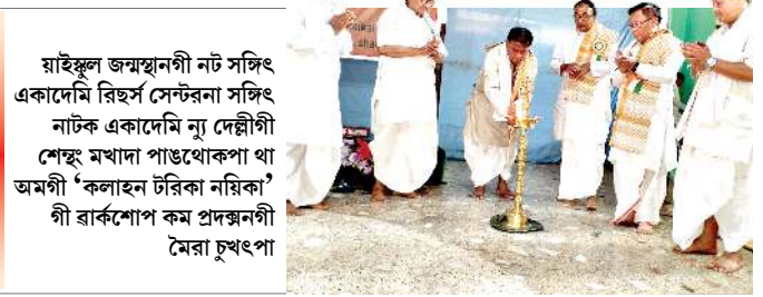
মাইকুল জম্মাননী নট সজিৎ একাদেমি ৱিৰ্ছ সেন্টনা সজিৎ নাটক একাদেমি ন্যু দেল্লীগী শেখু মখাদা পাণ্ডথোকুনা থা অমগী 'কলাহন টৰিকা নয়িকা' গী ৰাৰ্কশোপ কম প্রদৰ্শনী মৈৱা চুখংপা