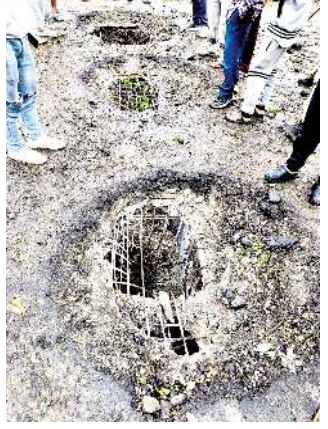
কুকি টেৱিষ্টশিংনা আই দি বিম ফুদুনা অকাৰ্য অতেই থোকহল্লমবা থোং

ইম্ফাল, এপ্রিল ২৪ (এইচএনএস) : চহী লিশিং ৩৪০০ হেনবগী পুৱাৱীয়া শাগোৱাৱল্লিবা মণিপুরী অপনবগী শৰুমা থুগাইৱগা তেঙানবা এডমিনিষ্ট্ৰেচন মচেৎ অমা ফকুনা লৌগনি হায়দুনা য়েলহৌ ফুৰুপ মীতৌ ওনাশিন্দুনা অত্ৰুনা অকনবা লান চখরিকিবা কুকি টেৱিষ্টশিংনা মণিপুরৰু মূখ্যখনবা হোংনবা থবকশিং লেপুনা চখরিকি।