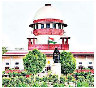
ঈ সী আইগী ৰিপোৰ্ট অদুৱা মীখলদা শীজিগাৱিবা ঈ ভি এমশিং অসি স্টেম্পৰ তৌবা গুহমহেদ অদুৱা মণিপুরী শীজিগাৱিবা মীওইশিংগী মৰজতী লামা শীজিগাৱা য়াৱা হায়বগী মতাংদা চপ চাবা ৰাক্বম শ্বেণ্ডোৱকখিবনি।

ন্যু দেল্লী, এপ্রিল ২৪ (এইচএনএস) : থা অসিগী ১৯দগী হৌথিবা লৈবাক অসিগী ১৮শুবা লোক সভা মীখলগী তাক্ক তৱেৎ থোক্স ভোট থাদনগদবা মীখলগী মাঙওইননা সুপ্ৰিম কোৰ্ট গুফ ইন্দিয়া মীখল অসিদা শীজিগদবা ইলেক্ট্ৰনিক ভোটিং মেজিন (ঈ ভি এম) শিংগা ভোৱ ভেৰিফাইএবল পেপৰ ওৱিট ব্লেৱৰ (ভিভিপিট) স্লিপশিংগা পূনা ক্ৰোস ভেৰিফিকেশন তৌববনি হায়দুনা ৰাক্বলকখিবা কেস অমগী ৰায়লে সুপ্ৰিম কোৰ্টনা ৰিজাৰ্ভ তৌদুনা থমশ্ৰে।