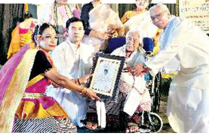
লম্বোইখোনাংখোঙা লৈবা মণিপুরী জগোয় মৰুপকী গোল্ডন জুবিলি উদযোজনাৰ মতামত মৰুপ অসি লিংখংখিবনী ৬১শতাব্দী কুমওন থৌৱম পাণ্ডথোকুনা শৰুয়াইৰবা জগোয়ী আৰ্টিষ্টশিংদা মনা লাম্বোকখিবা