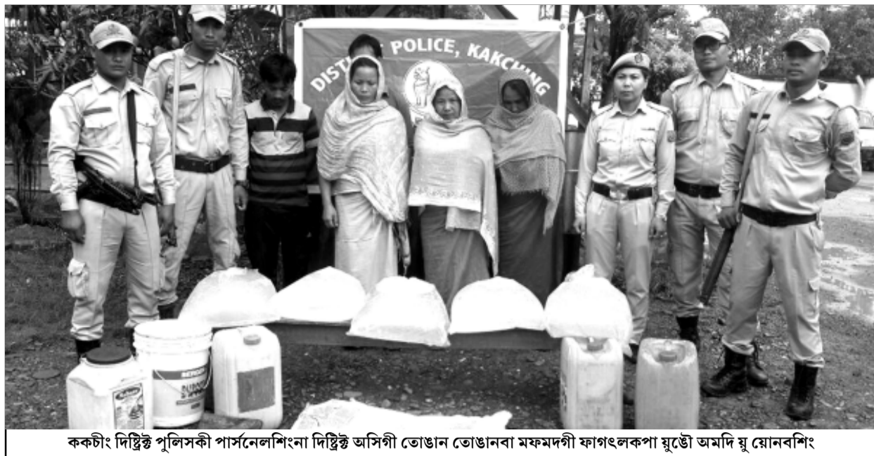
ককচীং দিষ্টিক্ত পুলিসকী পাসনেলশিংনা দিষ্টিক্ত অসিগী তোঙান তোঙানবা মফমদগী ফোংফলকপা মুঙে অমদি য়় য়োনবশিং

ট্রাফিক/অমাঙথোং অকোয়বদুগী মচি অমা ইন্থরকুগা লেবা, খোঙ হায়া খুদিংগী ঙ্গে হোপ হোপ তারকপা, খোঙ হায়া লোয়রগসু অমাঙথোংনা য়়ায়া চিকপা শাবা, পুজা য়়েকপা থিনবা তৌরগা খোঙ হায়া হায়াং তৌরগা লেবা, শা-ঙা, খাঙ, মোরোক অমদি অতৈক অনৌ চাবা য়়াদবা ফহনবগী ওজা ফাঙা উল হগ-পু থাগৎচরি