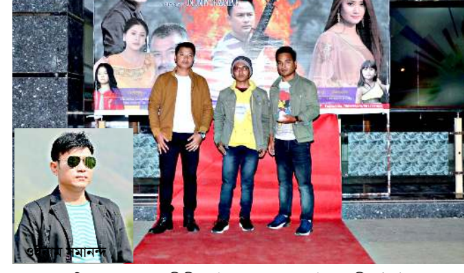
গুস্তাকপা অমদি অশোনবা মকুবোঁকী হীদাক লৈনবা

ইরমদম মণিপুরী নাং, কলচর অমদি লোল অসি হেমা চাওংখনবা