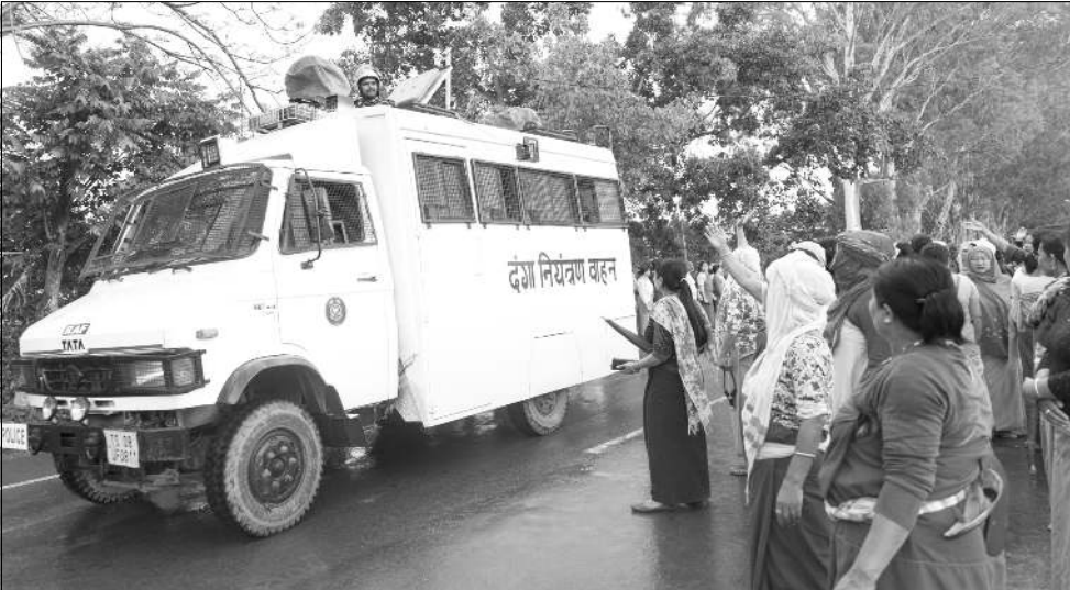
মাইৱাংদগী ইফাল তল্লা যৌদোকখিবা আৰ এ এফ টিমগী গাভিৰিং বিষ্ণুপুৰ মাইকৈদা অমুক হনবীৱৰুগু হায়না মাইকৈ অদোমগী ইমাশিংনা লাভিনখিবা

থোকশে। মথা তানা অসিগুহা থোদোকশিং অসি থোক্তনবগীদমক ৰাৱোইশিন পুৰস্কৰা কৰা হোংনৱি। চহি অসিগী মাৰ্চ থাদসু য়ুনিয়ন হোম মিনিষ্টর অমিট শাহগা উন্নদুনা হিৰম অসিগী মতাংদা খঙহনশ্ৰে। অমদি য়ুনিয়ন মিনিষ্টরগী মাইকৈদগীসু গুৱাহাটী ৰাখোৱা অসিগা মৰী লেননা নাকল অনিমক্কা য়াৱগদবা মওংদা ৰাৱোইশিন পুৰস্কৰ বা হোংনগনি হয়না থাজবা পীৱকপসু লৈশ্ৰে হয়ৱি।