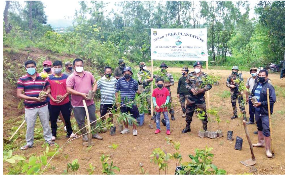
আই জি এ আর সাউথকী মিংয়েং মখাদা ককজি বটালিয়নগী ২৮ সেক্টরনা ককজি দিষ্ট্রিক্তী তোঙান তোঙানবা মফমশিংদা উ চারা থাখিবগী শক্তম

দিমাপুর, জুন ২৪ (এজেন্সী): নাগালেণ্ড পুলিস অমসুং অসাম রাইফলসকী অপুনবা টিম অমনা চখাখি থি হুইয়ান থবক এন এস সী এন (কে) গী কাদর ৭, এন এস সী এন (আই এম) গী কাদর ১ অমসুং নিকি স্মিট্রিগী ওভরপ্রাইভি (ও জি) মরি ফারে হায়রি।