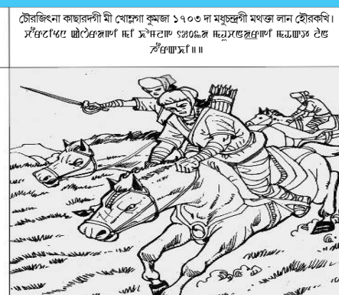
চৌৱজিংনা কাছাৱদী মী খোৎসো কুমজা ১৭০৩ দা মতুংগী মংগা লান হৌৱকখি।