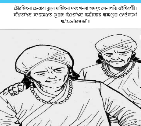
চৌৱজিংনা সেন্দ্ৰবা তুনা মাৰ্জিনা মংগ খনবা অমসুং সেনাপতি ওইৱিৰশী।