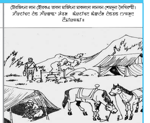
চৌৱজিংনা লান হৌৱকখি তবনা মাৰ্জিনা মাৰ্জিনা লাননা সেন্দুনা লৈৱিৰশী।