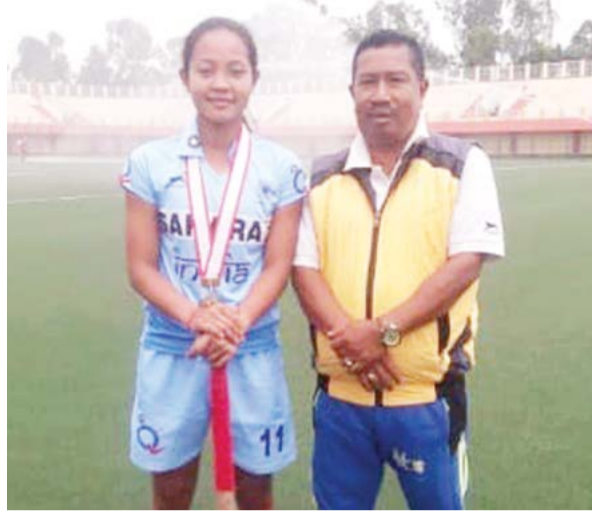
মশিং য়াম্মা উরমগনে। ইন্দিয়গী নেসনল টিমদা ঐথোয়গী অঙাং ফনা য়াম্মা য়াওরকগনি।