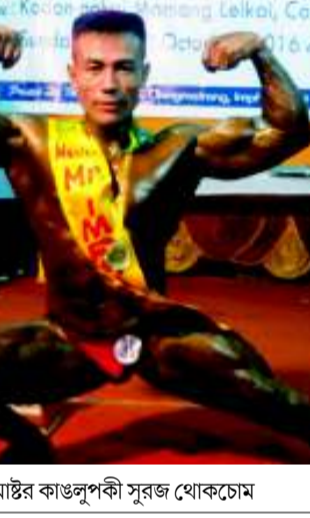
সেনিয়র টাইটল লৌজবা রিসিকান্ত নুপীগী ফিটনেসতা অহানবা তাম্ৰবা মোনারিতা জুনিয়র কাঙলুপকী জেমসন মাষ্টর কাঙলুপকী সুরজ খোকচোম