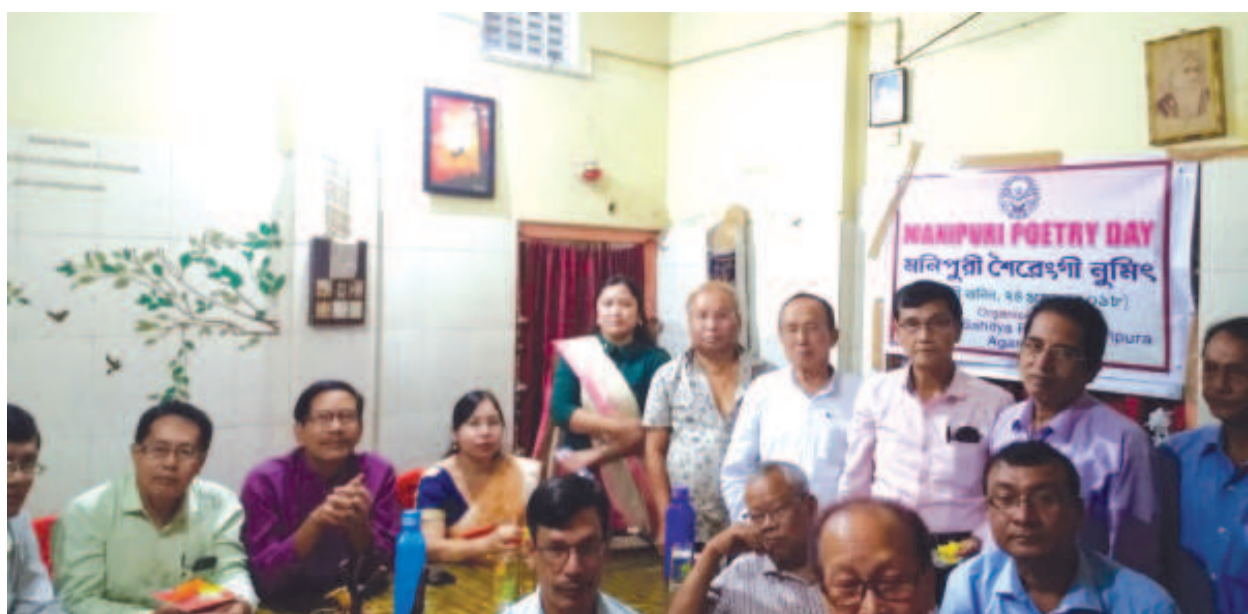
মণিপুরী সাহিত্য পরিষদ ত্ৰিপুরানা শীন্দনা অগৰটলাগী ধালেশ্বৰদা পাঙথোকখিবা মণিপুরী শৈৱেংগী নুমে যৌৱমগী শত্ৰম