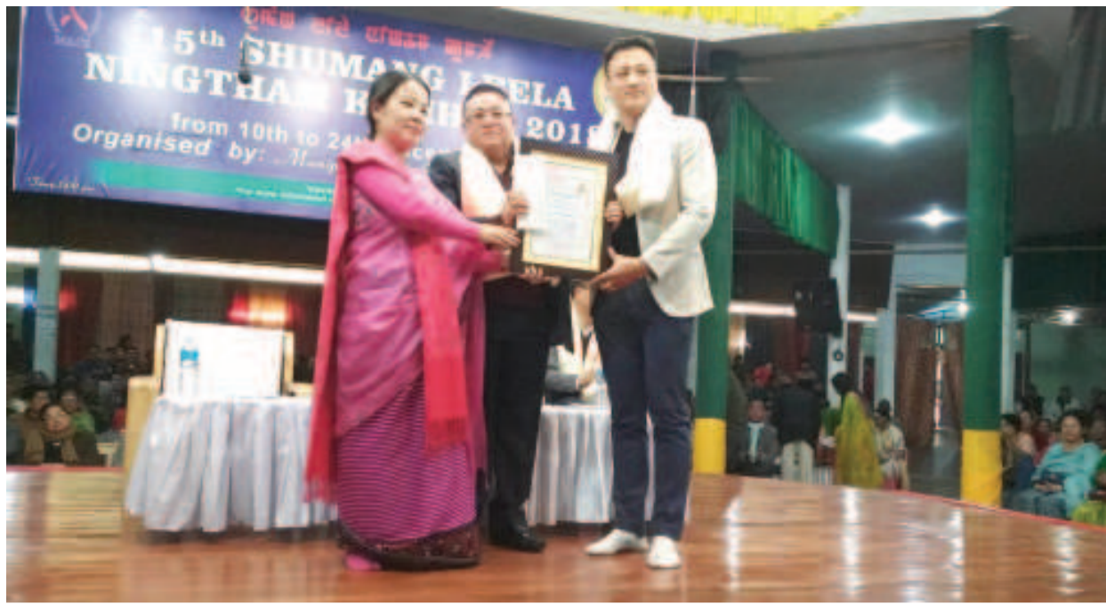
মণিপুর ষ্টেট শুম্ভাং লীলা কাওসিলনা চহী খুদিংগী পীবা পীদেনু এরাব্ অমসুং তোঙান-তোঙানবা এরাব্ কয়া লাহোকপগী শক্তম

ট্রাণ্ডেংগে/থবাক নাবা, থবাক ফনগংপা, শুর হোনবা ব্রাবা, যৌনাওদা অদুম থনগংলগা লৈবগুম তোবা, পুজা গ্যোষ্টিক কাবা, পুকচেন নাবা, চাবা থকপা যাদবা, নাকোংদা অদুম ওংলগা লৈবা, হকচাং মশা পুহা খিনদোকপা ফহনবগী ওজা জিয়া উল হকপু থাগৎচরি