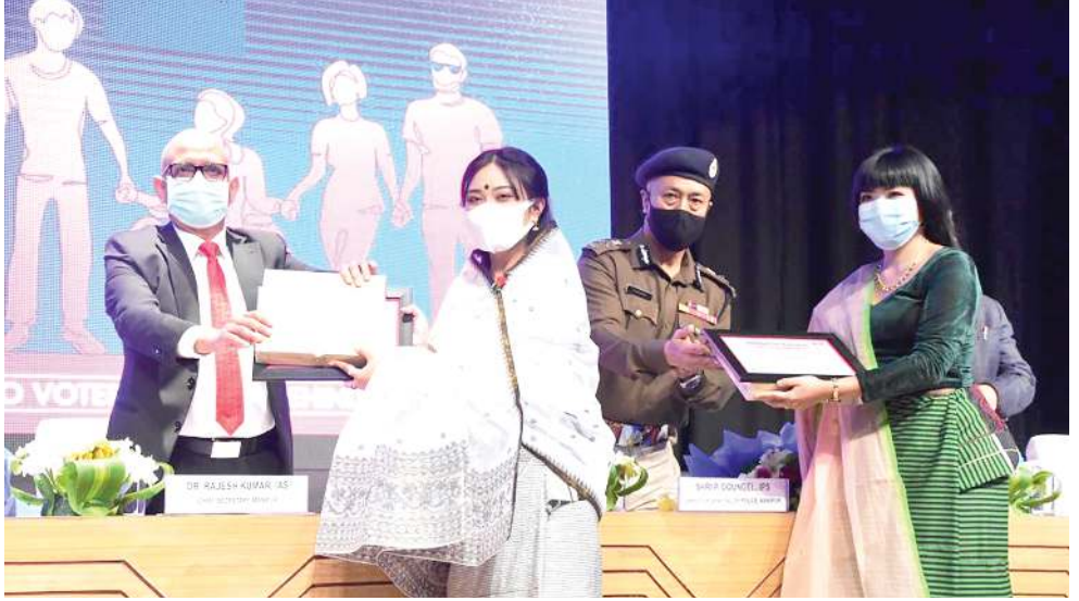
সিটি কনভেন্সন সেন্টারদা মণিপুরগী চাক সেক্টরতারা অখোইবা মীথুং ওইদুনা পাঙথোকখিবা ১২ শ্বা নোনল ভোটারস সৌী থৌরমদা এস ডি টি পি স্টেট আইকেনশিবু ফেলিসিটো তৌখিবা