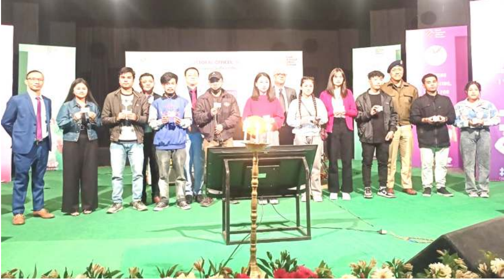
জে এন এম দি এগী ওদিতৌৱিয়মদা পাণ্ডথোকখিবা ১৩ শতা নেসনল ভোটস দে থৌৱমগা মৰী লৈননা নৌনা ভোটৰ চল্লক্সবা নহাংশিংগা লোয়ননা দাইজ মেম্বৰশিং

কোংগ্ৰেচকী ৱিৰজা তৌখিবগা লোয়ননা সী পি আই এমনা সিট ৪৩ গী কেন্দ্ৰিষ্টেশিং লাউথোকখিবনি। প্ৰেস কনফাৰেন্স অমদা লেক্চাৰ ফিল্ডকী কনভেন নৱায়নকৰনা হায়খি, এংখোয়গী মকুওইবা পান্দমদি বি জে পি ৱাৰ্কৰগী পৰাৱদগী জিথুবা অসিনি। এংখোয়না বি জে পি ৱাৰ্কৰগী পৰাৱদগী জিথুনা অমসুং পাটি অসিবু ষ্টেট অসিগী লৈখন্দনবা মায়বা বেনৱগী মখানা খুংশুল্লি। এংখোয়না এণ্টি-বি জে পি ওইবা সেকুলৱ অমসুং দেমোকেটিক ফোৰ্চ পুম্ভতা সেৱেন পাটি অসিবু লৈখন্দনবা পৰাৱদগী জিথুনা খুংশুল্লনা চংমিনবা আপিল তৌৱি।