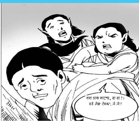
ববা চাক লামে, বা বা! ষ্ৰুই ষ্ৰুই ষ্ৰুই, ষ্ৰুই!