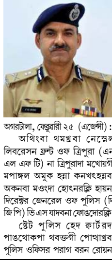
অগরতীলা, ফেব্ৰুৱাৰী ২৫ (এজেন্সী) : অধিবংগা থমস্তৰা নেম্বেল লিবৰেসন ফ্ৰন্ট ওফ ত্ৰিপুরা (এন এল এফ টি) নৱা ত্ৰিপুরাদা মখায়গী মপাঙ্গল অমুক হুমা কনখংনবা অকনবা মওন্দা হোংনরক্কি হায়না দিৱেন্স্তৰ জেনৱেল ওফ পুলিস (দি জি পি) ভিএস যাদবনা ফোঙদোরক্কি।

ইবা লাভিবিক অমা ফোঙদবগী খৌরম অমগা মরী লৈনান ত্ৰিপুরাগী দি জি পিনা ৰাফম আসি ফোঙদোরকখিবনি। মহায় মখা তানা পাউজীশিংদা ফে ১ ৬ দোক খিবদা হৌখিবা লৈবাপোকপা নুমিত্তা এন এল এফ টিগী মেন্ধৰ অস্তম ত্ৰিপুরা পুলিসনা ফাখি। মখায়গী শেলগী দিমন্দ তৌনবা চেসিং অমদি মোবাইল ফেনশিং ফাগংগা গুমখি। মখায়না শীজিমৰদা মোবাইল ফেন অদু কন্য কনাদা ফেন তৌৱনগৈ হায়বদুগী মতংদা এঞ্জাৰ্চিশিং থিৎজি।