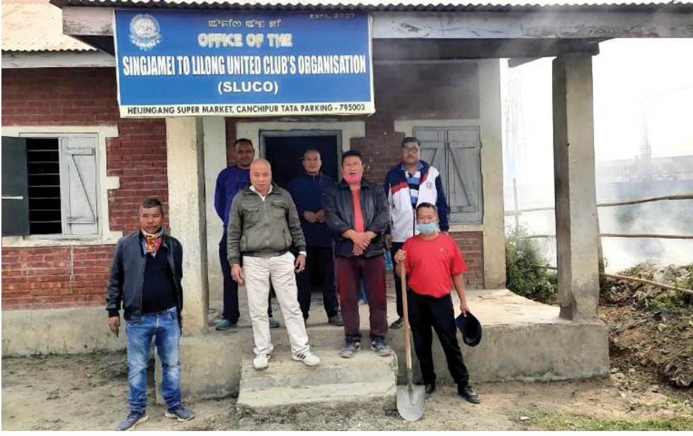
মণিপুর প্লেয়ার্স দে খৌরমগা মরী লৈনান শিংজমৈদগী লিলোং ফাওবদা লৈবা ক্লাব ৬৪ গী এপেঞ্জ বোদি ওইরিবা হৈজিগাং সুপার মাৰ্কেটত লৈবা শিংজমৈ টু লিলোং য়ুনাইটেড ক্লাবস ওৰ্গানাইজেশন (এস এল যু সী ও) গী কমপ্লেক্সতা শিং-শেংবগী খৌরম পাউথোকখিবা