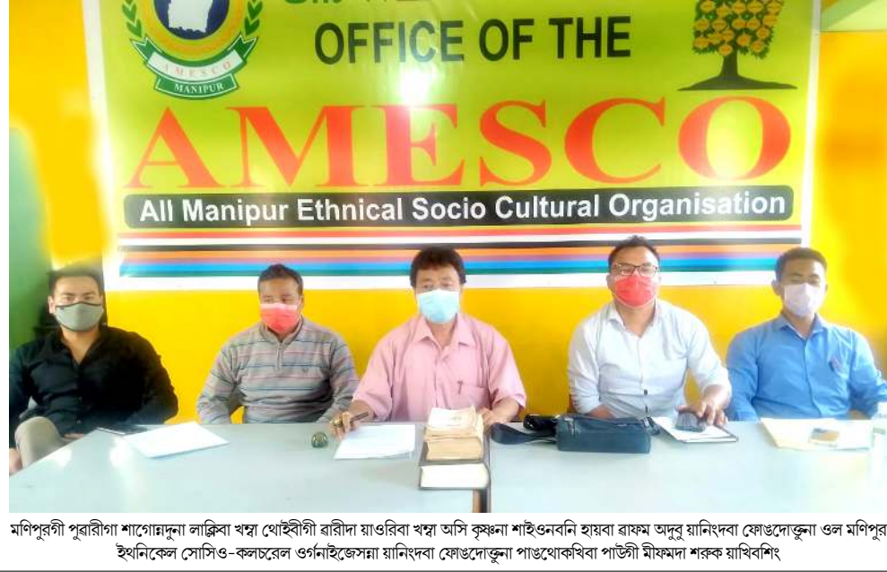
মণিপুৰগী পুৱাৰীগা শাগোমদুনা লাক্ৰিবা খহা হোইশিংগী ৱাৰীদা যাওৱিবা খহা অসি কুৰুনা শাইওনবনি হায়বা ৰাফম অদুৰু যানিংদবা ফোণ্ডোত্ৰুনা ওল মণিপুৰ ইথনিকেল সোসিও-কলচাৰেল ওৰ্গানাইজেশ্বনা যানিংদবা ফোণ্ডোত্ৰুনা পাণ্ডথোকথিবা পাউটী মীফমদা শৰুক যাবিশিং