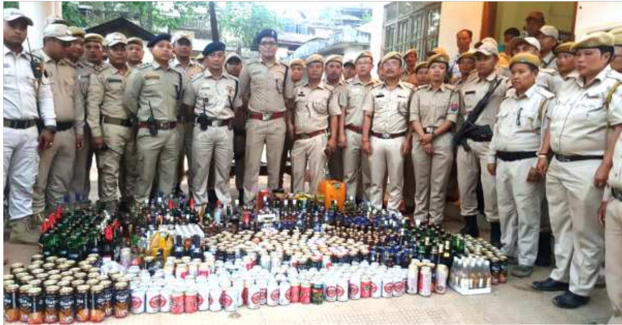
তেংনৌপল দিল্লিষ্টকী এস পি ডা. সরাংথেং ইবোমচানা লুচিংবা চিমনা মোরে টাউনদনী ফাগৎলকপা তোঙান তোঙানবা মখলগী মুঙাংশিং

টোম্বাং/অমাঙথেং মনুংদা খুজিল্লগা খোঙ হান্দা য়াম্মা নাবা, খোঙ হান্দা খুদিংগী শৌজ নাহুবা, অমাঙথেং ময়াদা পোমথোক্লগা লেবা, অমাঙথেং অকোয়দা মরেং মরেং চংলগা য়াম্মা হাঙ্কৎচবা, খোঙ হান্দা চাং নাইদবা ফহনবগী ওজা জিয়া উল হগ-পু থাগৎচরি